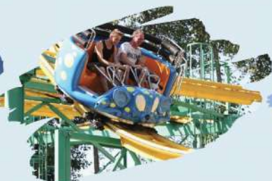
Les Souris Verte