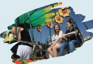
La Samba des Z'Abelles

TARIFS ADAPTÉS POUR TOUS PARKING GRATUIT