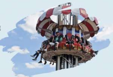
La Tour Yoyo