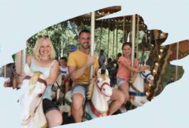
Le Carrousel 1900