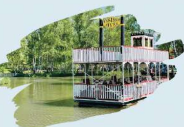
Le Bateau Mississippi