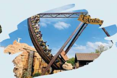
L'Arche de Noé