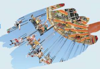
Les Chaises Aériennes