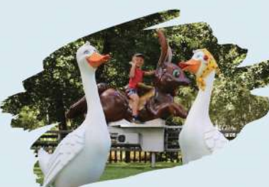
Les P'tits Lapins

LE PLAISIR DE PARTAGER UN MOMENT DE BONHEUR POUR UNE JOURNÉE PLEINE D'ÉMOTIONS ET DE SENSATIONS