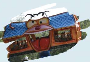
La Maison Foldingue

ET ENCORE + D'ATTRACTIONS VOUS ATTENDENT POUR LES PETITS MAIS AUSSI LES GRANDS !